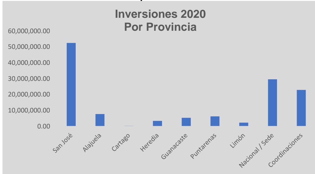
Gráfico No.4 Instituto Costarricense de Acueductos y Alcantarillados Dirección de Planificación Estratégica Plan de Inversiones 2020 Por provincia

Como se puede observar en los gráficos N° 3 y 4, la mayor parte de la inversión programada para 2020, se realizará en la región Metropolitana y en la provincia de San José, esto porque en esta provincia se lleva a cabo el proyecto “Mejoramiento Ambiental de Área Metropolitana” seguido de los proyectos que afectan a nivel nacional y coordinaciones de las Unidades Ejecutoras y dependencias encargadas de la preinversión.