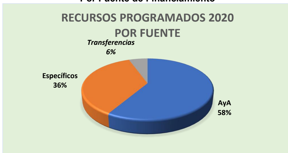
Gráfico No.2 Instituto Costarricense de Acueductos y Alcantarillados Dirección de Planificación Estratégica Plan de Inversiones 2020 Por Fuente de Financiamiento

En forma gráfica, se expone a continuación cada una de las fuentes de financiamiento