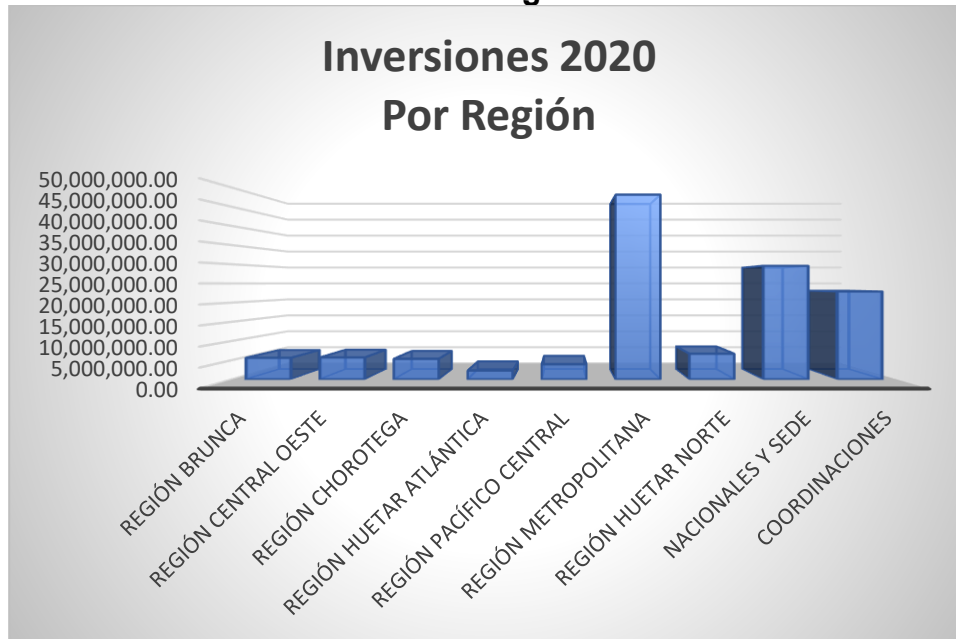
Cuadro No.26 Instituto Costarricense de Acueductos y Alcantarillados Dirección de Planificación Estratégica Inversiones a Nivel de Provincia Programación Financiera Año 2020